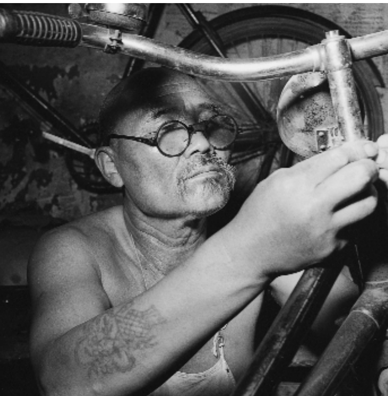
Fahrradhändler, 1957

nicht befreundet war, aber zu denen ich sehr guten Kontakt hatte. Ich bin immer sehr schnell mit Menschen in Kontakt gekommen. Das ging mir auch in China so, was für Ausländer nicht gerade selbstverständlich ist. Das bedeutet nicht, dass ich die Chinesen besonders gut verstehe. Bis heute kann ich vieles nicht verstehen, weil die Mentalität völlig anders ist.»