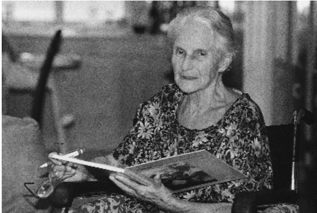
Eva Siao, die große alte Dame der Reportagefotografie, in ihrer Pekingener Wohnung.

Die in China lebende, deutschstämmige Fotografin Eva Siao hat die wohl eindrucksvollste und umfassendste Dokumentation des Alltags in Maos China geschaffen. PHOTOGRAPHIE-Autor Rainer Zerback hat die heute 89-jährige Fotografin in ihrer Pekingener Wohnung besucht.