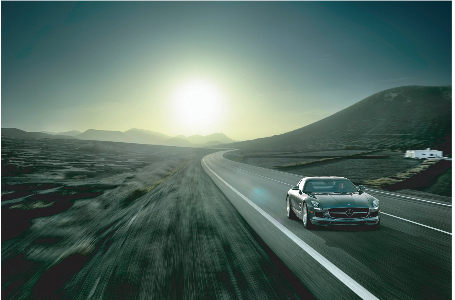
Abbildung E.1