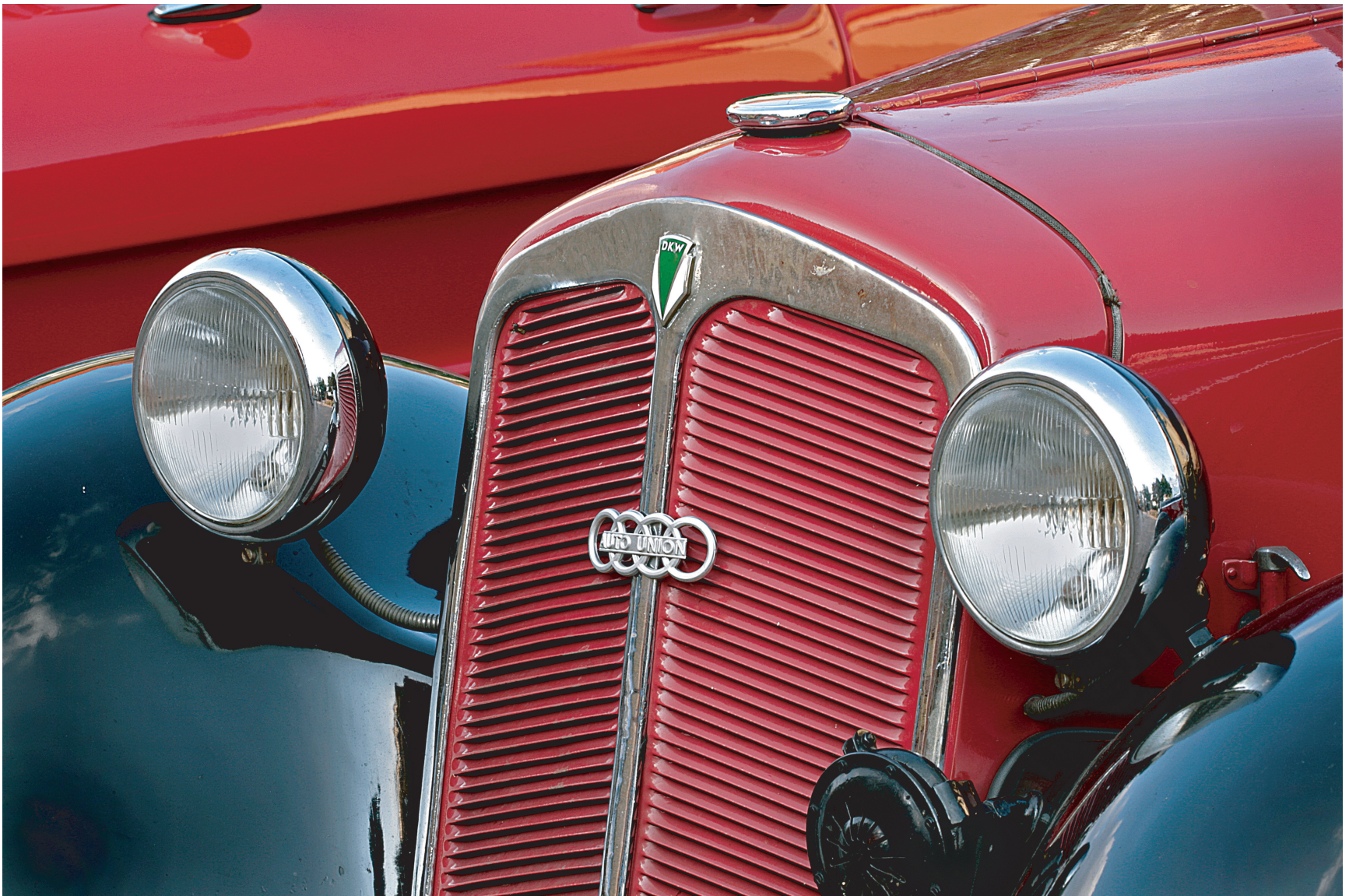
Abbildung E.2

Das Jahr 1973 markiert einen Wendepunkt in der öffentlichen Wahrnehmung des Autos. War bis dahin unsere Bewertung des Autos durchweg positiv, änderte sich dies mit der – man ist fast geneigt zu sagen: ersten – Ölkrise schlagartig; es kam ein Bewusstsein für die Vielschichtigkeit des Autos und der Automobilität auf, das bis heute unser Verhältnis zum Auto bewusst und unbewusst prägt. So umfasst das Auto eine Vielzahl emi-